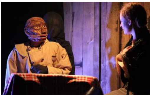
Illustration Etienne Meunier

Fabrication des marionnettes Titi Mendes, Manon Lucas